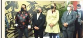
MEXICALI.- El espacio da un nuevo sentido a la cultura china en la capital de Baja California.