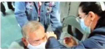
TIJUANA.- La vacuna está cerca de llegar a las zonas urbanas del estado, especialmente a Tijuana y Mexicali.