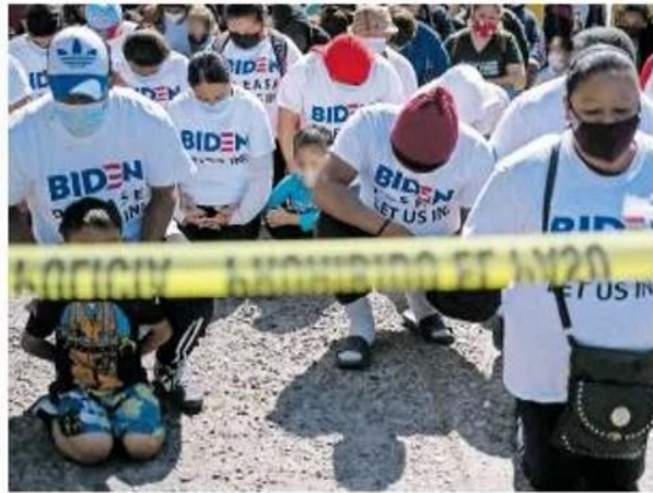
Esta caminata convocó a migrantes centroamericanos, haitianos y mexicanos, que llevan durmiendo casi 15 días en la explanada de la garita de El Chaparral.

Las semanas pasan y los migrantes no reciben respuestas que les den esperanzas de que su proceso de asilo político sea iniciado por el gobierno de Estados Unidos. La desesperación llevó a decenas de migrantes a realizar una caminata pacífica desde el campamento en El Chaparral hasta la garita de San Ysidro, en donde a escasos metros de la “tierra prometida”, se arrodillaron y rezaron para ser escuchados por el gobierno de Biden. Pág. 7