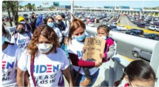
TIJUANA.- En la manifestación había niños que son considerados vulnerables por los organizadores.

TIJUANA.- Con camisetas en las que se leía "BIDEN PLEASE LET US IN!" (Biden por favor déjenos entrar), decenas de migrantes latinos y centroamericanos que mantienen plantones garita de "El Chaparral" marcharon este martes a la garita internacional de San Ysidro para ser escuchados y atendidos por las autoridades de Estados Unidos respecto al asilo político.